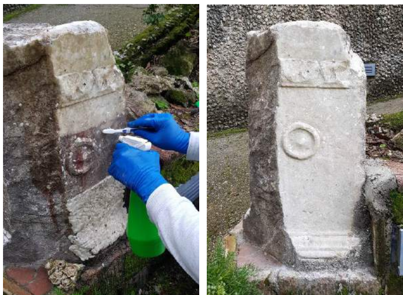
Figure 10-11 Superficie durante e dopo la rimozione dell'impacco biocida e risciacquo