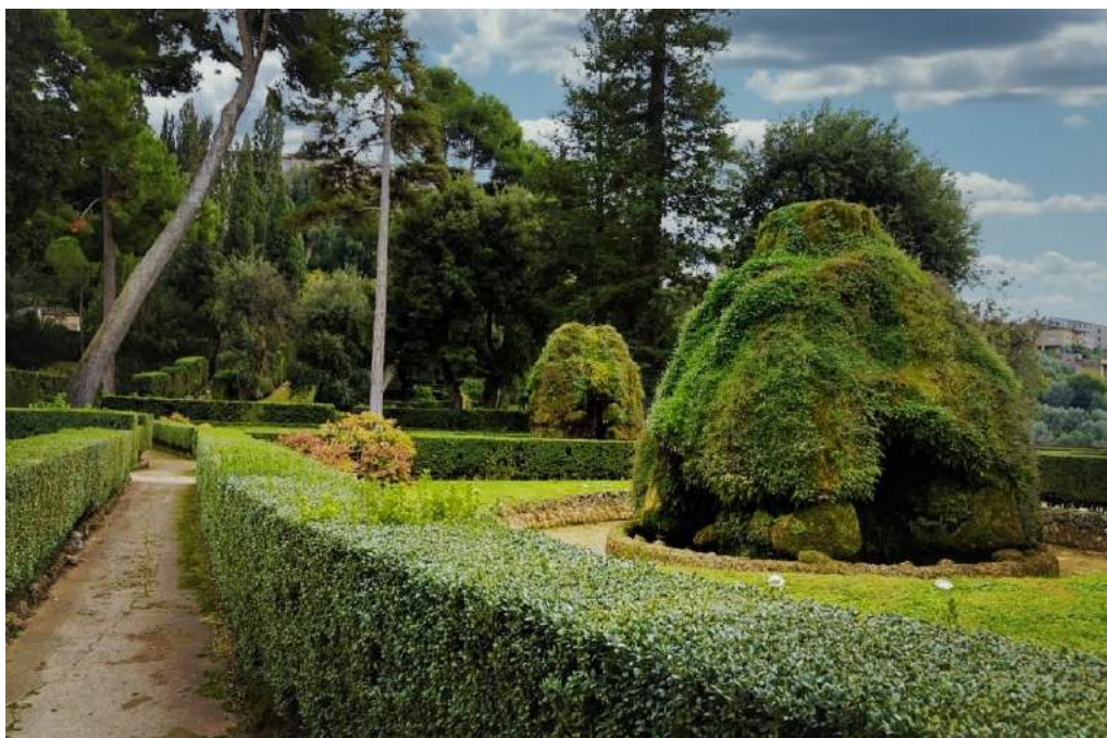
Le fontane delle Metae Sudantes nel giardino di Villa d'Este

L'Istituto Villa Adriana e Villa d'Este gestisce storicamente, tra gli appalti di servizi, quello relativo alla manutenzione ordinaria delle fontane e conduzione dell'impianto di depurazione al loro servizio. Nell'ambito di questo appalto, gli addetti fontanieri 1 da molti anni si occupano della pulizia degli involucri e del costante controllo dei getti d'acqua per tramandare e conservare la funzionalità e la magnificenza di un sito conosciuto in tutto il mondo. Si deve considerare che i recenti studi sullo stato dell'arte del sistema di filtrazione all'interno del processo di depurazione e delle diramazioni a servizio delle fontane mettono in evidenza la necessità di un costante controllo e di un alto livello di attenzione, concretizzabile, anche