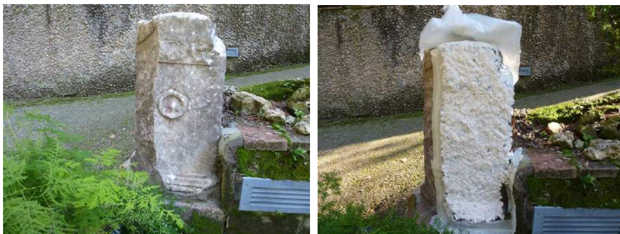
Figure 8-9 Applicazione del trattamento biocida a base di oli essenziali su manufatto lapideo: prima e durante

Per meglio valutare l'efficacia del metodo a base di oli essenziali, mettendolo a confronto con i metodi di disinfezione tradizionali, si è deciso di effettuare una ulteriore applicazione campione su un cippo lapideo presente lungo uno dei percorsi della Villa: nello specifico una delle facce è stata trattata con biocida tradizionale mentre l'altra con gli oli essenziali.