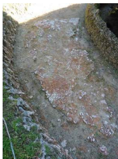
Figure 1-2 Porzione del fondo della vasca prima della pulitura

Dopo una prima rimozione di fanghi e depositi limosi presenti sul fondo della vasca, cui ha fatto seguito una pulitura meccanica del lacerto di pavimentazione in esame, è emersa in realtà una decorazione, prima completamente nascosta dal deposito coerente presente sulle superfici, costituita da frammenti lapidei bianchi e neri e frammenti in cotto rosso allettati su malta con aggregato pozzolanico disposti a formare motivi decorativi apparentemente geometrici o stilizzati, ma non ancora identificati in modo definitivo. Si ipotizza che un motivo simile possa esistere anche nell'altra fontana gemella dove, oltre alle tracce dell'allettamento, sono attualmente visibili alcuni lacerti di decorazione al di sotto degli strati terrosi. Per