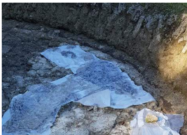
Figure 5-6-7 Fasi di stesura della miscela di olii essenziali