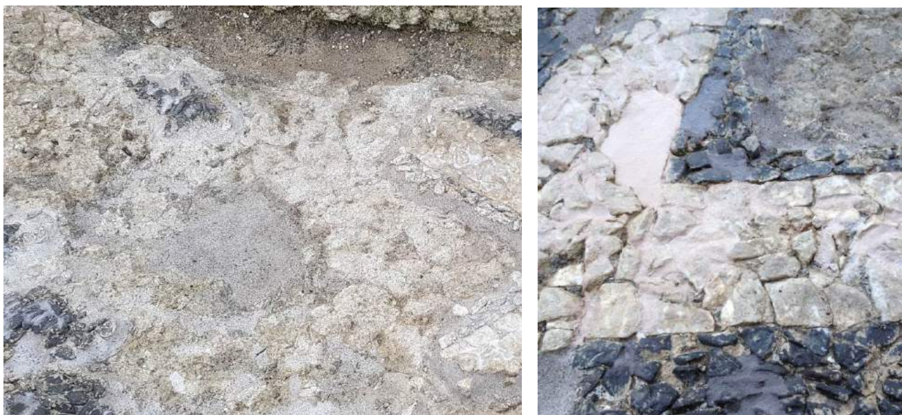
Figure 12-13 Stucature con mala 'tradizionale'(sx) e stucature con malta a base di premiscelato con caratteristiche impermeabilizzanti (dx)

nuovamente le vasche di acqua, monitorare l'aspetto, le prestazioni e la tenuta di entrambe le tipologie di integrazioni nel tempo per una valutazione completa dei diversi aspetti conservativi 10 .