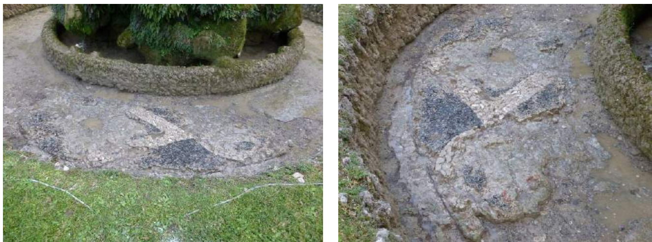
Figura 3-4 Decorazione policroma rinvenuta dopo la pulitura

accertare tali ipotesi e per comprendere la natura della decorazione–occorrerebbe estendere la pulitura, e contestualmente condurre una ricerca approfondita attraverso le fonti letterarie e iconografiche esistenti 4 .